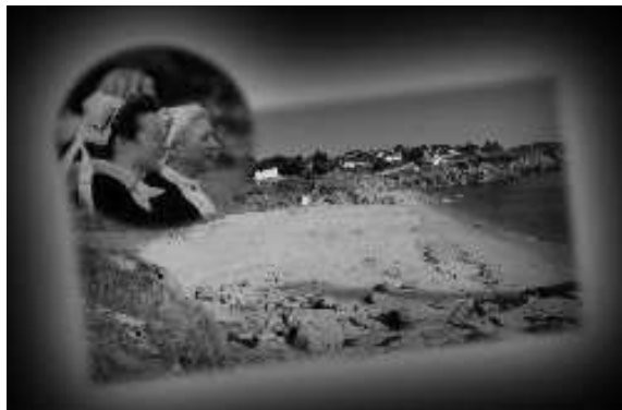
Plage de Trégana